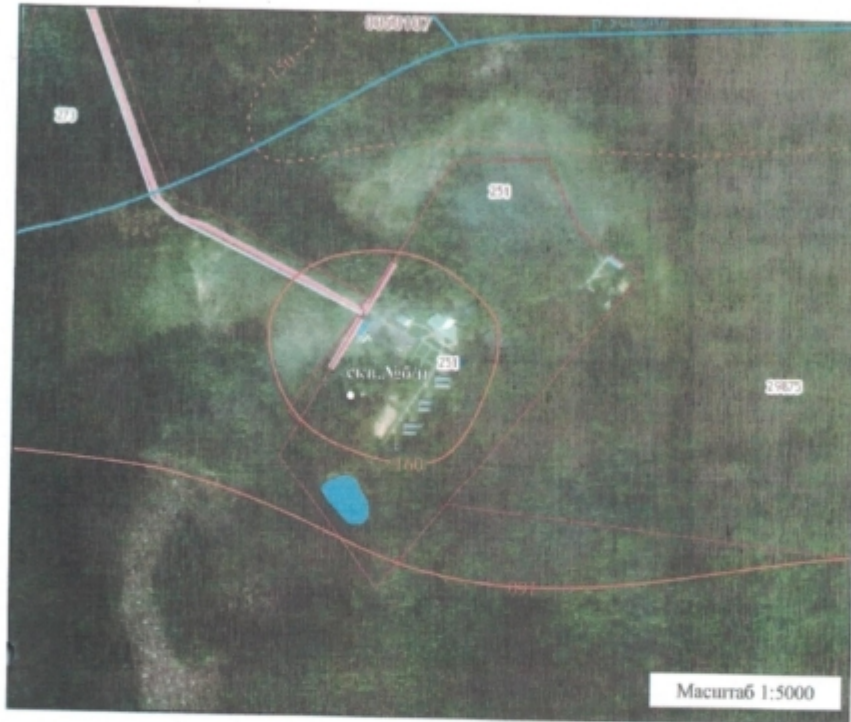
Схема расположения участка недр ГАУСО МО «КЦСОиР «Егорьевский» для добычи полезных вод для питьевого хозяйственно-бытового водоснабжения, расположенного в Московской области, г.о. Егорьевск, пос. Сергиевский, д. 41