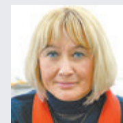
Ирина ФАЕВСКАЯ, министр социального развития Московской области: